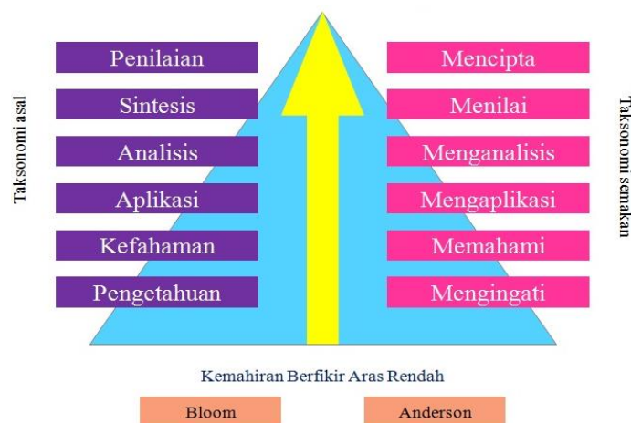
Rajah 2. Aras Teori Taksonomi Bloom dan Anderson